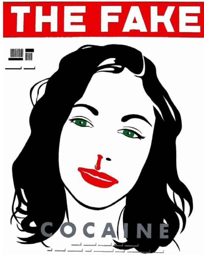
The Fake – Cocaine , 2006 Acrylic on canvas, 200 x 160 cm