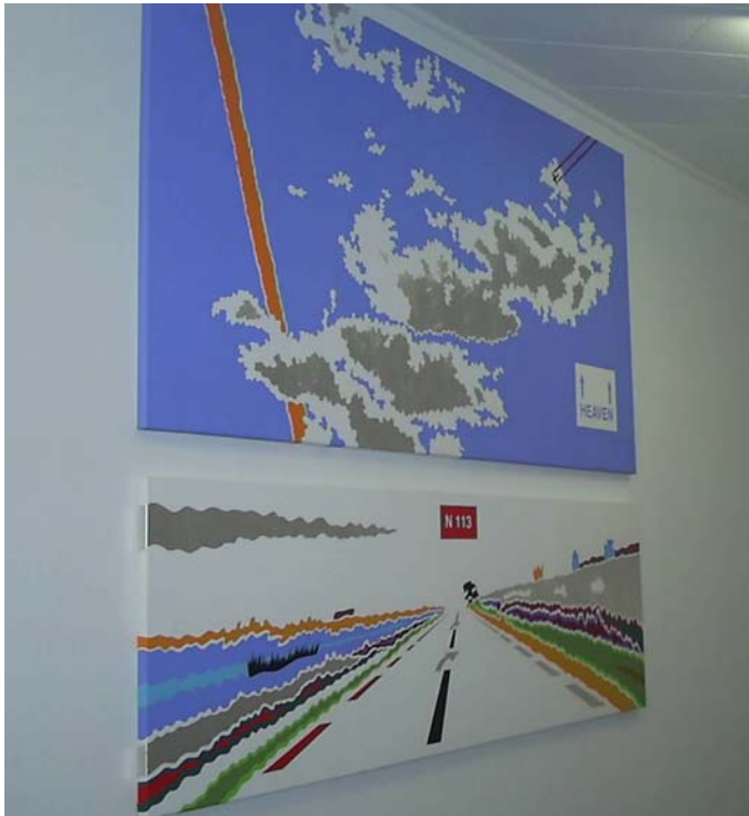
Heaven , 2005 - Acrylic and aluminium foil on canvas, 200 x 100 cm

Les roads jouent également sur le rapport infini/à plat en jouant avec les perspectives tronquées. Les heavens reprennent la signalisation routière pour indiquer un espace de l'ordre du spirituel (le paradis, les cieux). Pas de perspective dans les cieux mais ironiquement également marqués par la présence humaine : les avions (touristes, bombardiers ?) et leurs traces rectilignes (pollution) comme éléments de désacralisation.