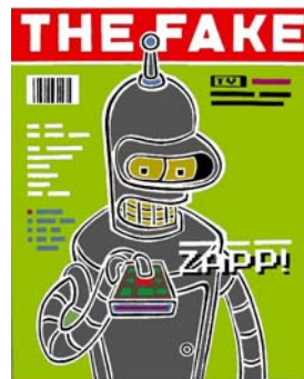
The Fake , 2006 Acrylic and aluminium foil on canvas, 50 x 40 cm