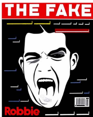
The Fake , 2006 Acrylic and aluminium foil on canvas, 100 x 80 cm