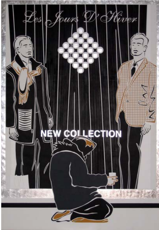
Les Jours D'Hiver, 2009 200 x 140 cm