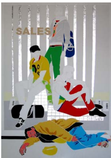
Sales, 2008 200 x 140 cm