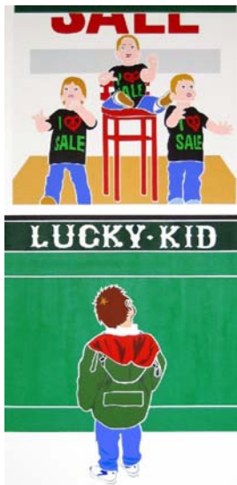
Lucky Kid, 2008 200 x 100 cm