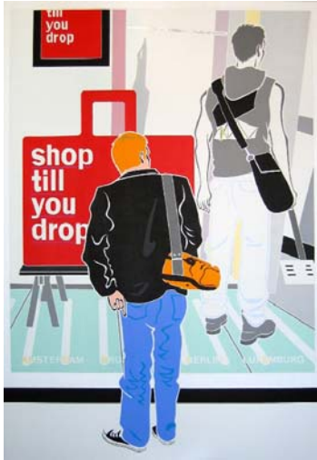
Shop till you drop, 2008 200 x 140 cm